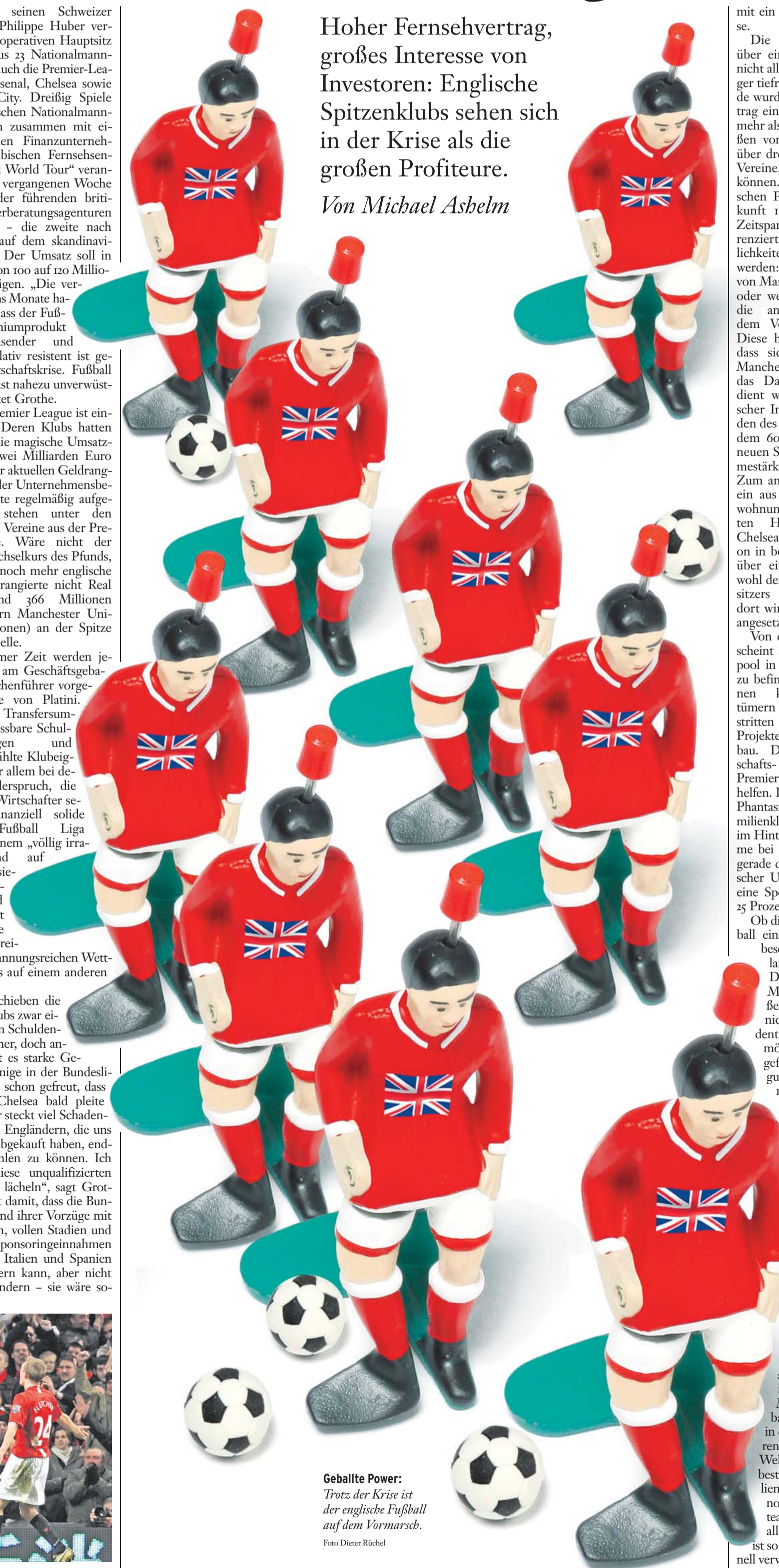
Geballte Power: Trotz der Krise ist der englische Fußball auf dem Vormarsch.