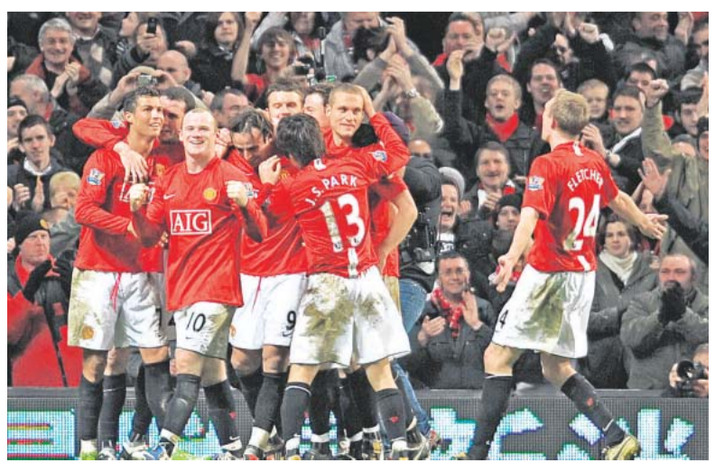
Helden des Fußballs: Manchester United als Publikumsmagnet